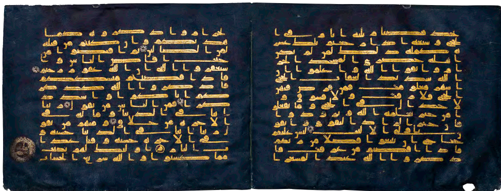
Bifolio de un Corán, Kairuán, finales del siglo IX-principios del siglo X, pergamino, oro, plata y tinte azul, 28 x 75,8 cm (desmontado). Vaduz, Furusiyya Art Foundation [R-8001]

Tomando su nombre de la palabra árabe luz, tanto en el sentido físico como en el metafísico, Nūr presenta una organización temática con dos secciones principales: una, dedicada al arte, que incluye manuscritos iluminados con pigmentos dorados y de colores, cerámicas de lustre, obras en metal con incrustaciones de plata y oro, así como piezas realizadas en piedras preciosas y semipreciosas. Y otra, centrada en el campo científico, en la que destacan relojes solares ecuatoriales, astrolabios e instrumentos anatómicos, ilustrativos de la influencia del mundo islámico en el pensamiento científico.