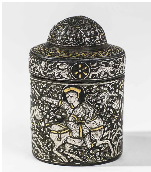
Tintero, Alta Mesopotamia o Persia occidental, ca. 1275, aleación de cobre, incrustación de oro y plata, alto 5,9 cm. Vaduz, Furusiyya Art Foundation [R-2032]

La Fundación Focus-Abengoa estrena una importante exposición itinerante de arte y cultura islámicos que abarca más de diez siglos e incluye obras de arte y objetos seculares procedentes de todo el mundo islámico, desde España hasta Asia Central. Nūr: La luz en el arte y la ciencia del mundo islámico explora el uso y el significado de la luz en el arte y la ciencia islámicos, y demuestra cómo la luz constituye un motivo unificador en las civilizaciones islámicas a nivel mundial. La exposición, dirigida y comisariada por la doctora Sabiha Al Khemir, experta en arte y cultura islámicos, incluye más de 150 objetos cedidos de colecciones públicas y privadas que nunca antes habían dejado su país de origen, ni habían sido expuestos, en muchos de los cuales el legado de al-Andalus está presente.