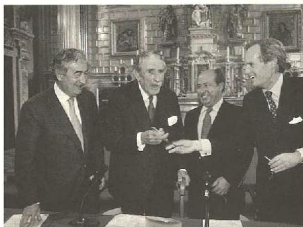
Lord Douro entrega el premio al Presidente de Focus-Abengoa

El Duque de San Carlos, Presidente de Patrimonio Nacional y Vicepresidente de la Fundación Montblanc, cuyas palabras reproducimos íntegras en otra parte de este Boletín, destacó en su semblanza del premiado: «Ha tenido siempre la preocupación de discurrir soluciones propias y originales; es decir, el I+D antes de que se llamase así. Por eso en las sucesivas crisis pudo mirar hacia adelante y, en lugar de quejarse, enfocar su grupo a la electrónica». Lord Douro, Presidente de la Fundación Montblanc, entregó al premiado 15.000 euros (unos dos millones y medio de pesetas) que deberá destinar a un proyecto artístico. José Ferrer Sala, Presidente de Honor de Freixenet, y Carmela Arias, Condesa de Fenosa, galardonados en España en las anteriores ediciones, asistieron también al acto.