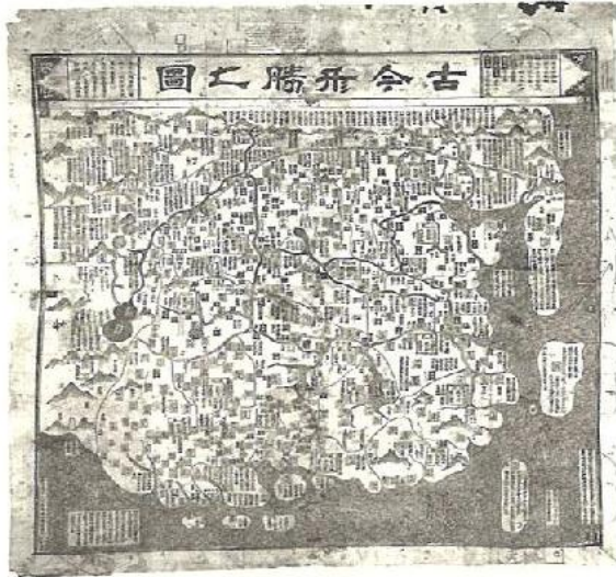
«Mapa de la China» Sevilla. Archivo General de Indias

primera ruta comercial entre tres continentes: Europa, América y Asia, que no sólo nos evoca un mundo exótico sino también la llegada del castellano, de la religión católica y de la organización española a Filipinas y a otras regiones del Pacífico como las islas Marianas y las Carolinas y cierta prolongación