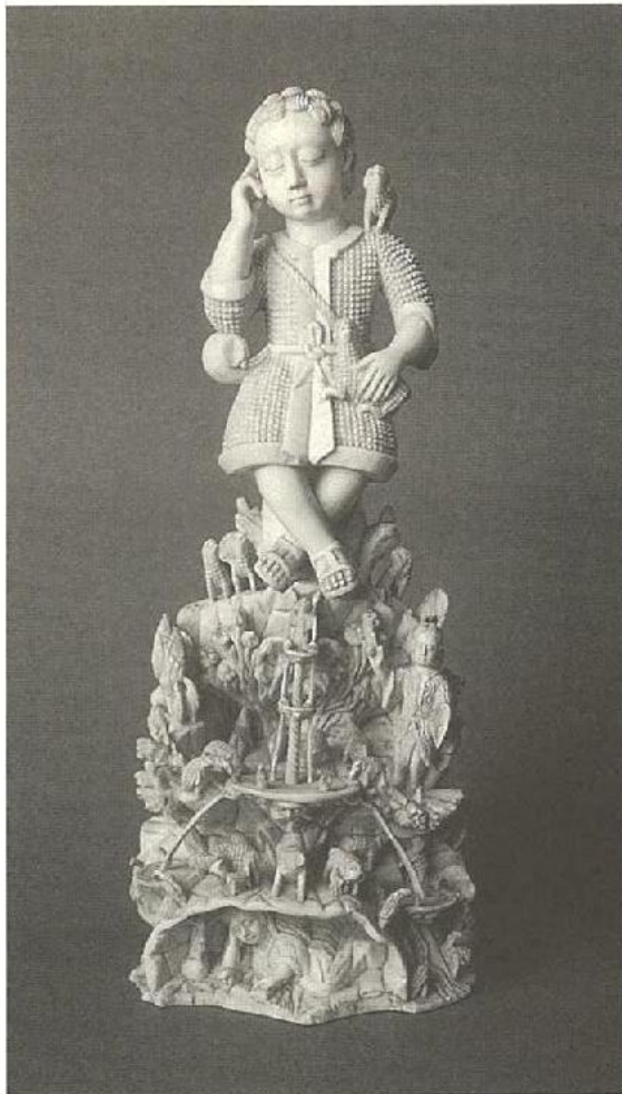
«El Divino Pastor sobre la fuente de La Gracia». Goa. Indo-portugués. Siglo XVII. Madrid. Museo Nacional de Artes Decorativas

primera ruta comercial entre tres continentes: Europa, América y Asia, que no sólo nos evoca un mundo exótico sino también la llegada del castellano, de la religión católica y de la organización española a Filipinas y a otras regiones del Pacífico como las islas Marianas y las Carolinas y cierta prolongación