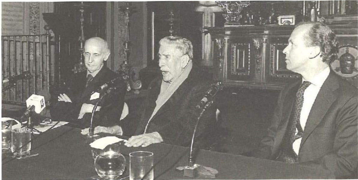
Acto de Presentación de los Premios Rey Jaime I.