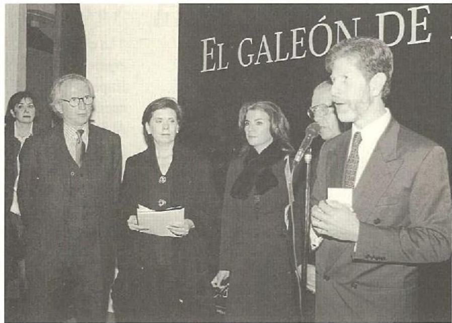
México. Inauguración exposición El Galeón de Manila

del Consejo Nacional para la Cultura y las Artes, como del Embajador de España en México y del Presidente de la Fundación Franz Mayer, fueron de agradecimiento por la intensa labor conjunta de ambos países, que ha hecho posible que el Galeón que partiera en el siglo XVI desde Sevilla, arribe de nuevo en el siglo XXI a México.