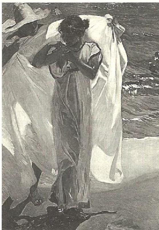
«Después del baño» (1908). Joaquín Sorolla. The Hispanic Society of America