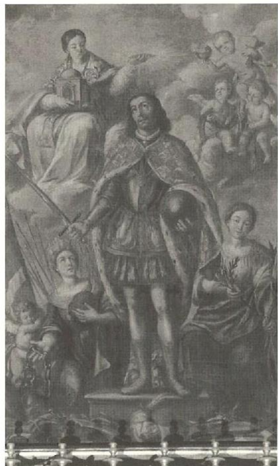
«Apotheosis de San Fernando». Lucas Valdés.

Al fondo de la nave, a la izquierda, figura una escultura de San Fernando sedente y de tamaño inferior al natural, obra de Pedro Roldán, realizada en 1698 y estofada por Lucas Valdés.