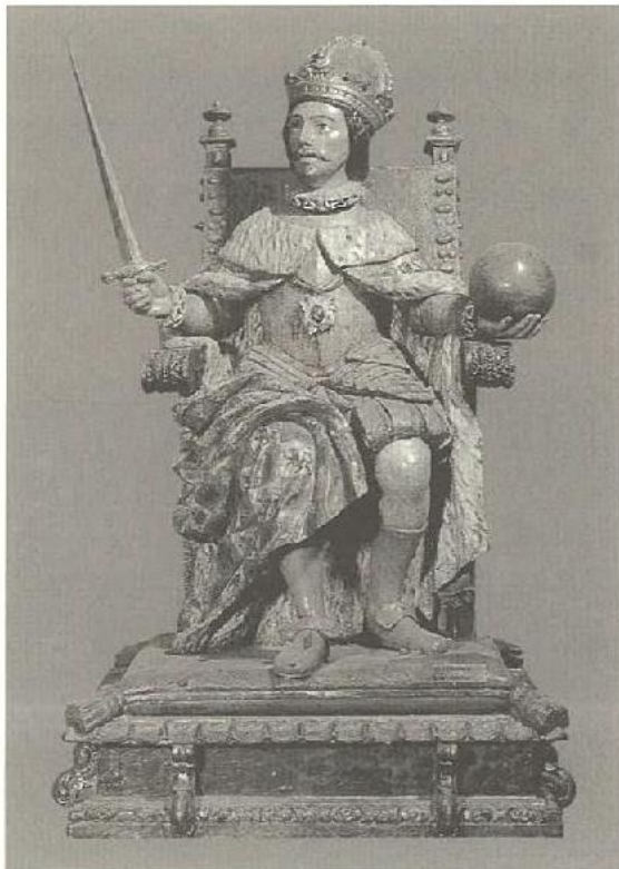
«San Fernando» (1698). Pedro Roldán.