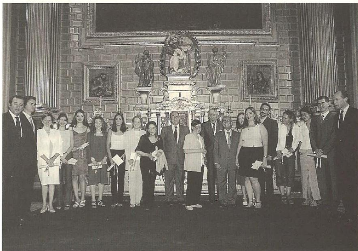
Premios Focus-Abengoa 2000

En el transcurso del evento el Vicepresidente expuso una síntesis de las actividades desarrolladas en el curso 2000-2001 que ahora termina, resaltando las exposiciones El Galeón de Manila , inaugurada por S.M. el Rey, y De Goya