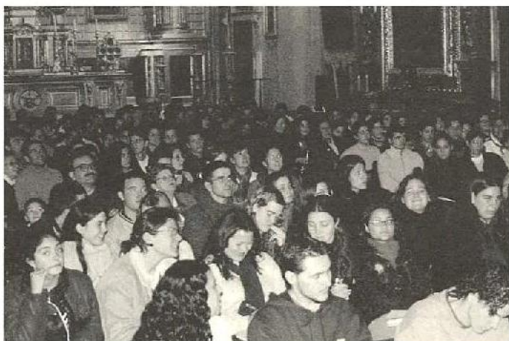
Estudiantes de Educación Secundaria en Audición Didáctica.

Si miramos hacia atrás, lo realizado nos hace sentirnos satisfechos, aunque ahora es preciso mirar hacia adelante y conseguir nuevos logros. Con este objetivo alimentamos una doble ilusión de futuro que se plasmará primero en una grabación discográfica, original en contenido y realizada íntegramente en este instrumento; en segundo lugar aspiramos a iniciar los trabajos de estudio para la preparación de un Gran Premio Internacional de Órgano «Focus-Abengoa» en Sevilla, en correspondencia con los ya tradicionales de París y Chartres. Liderar dicho Premio, con el apoyo y patrocinio de instituciones públicas y privadas, supondrá un revulsivo importante en orden a la divulgación de la música organística española, y concretamente sevillana, además de estimular a jóvenes valores que prometen convertirse en maestros destacados de la música internacional.