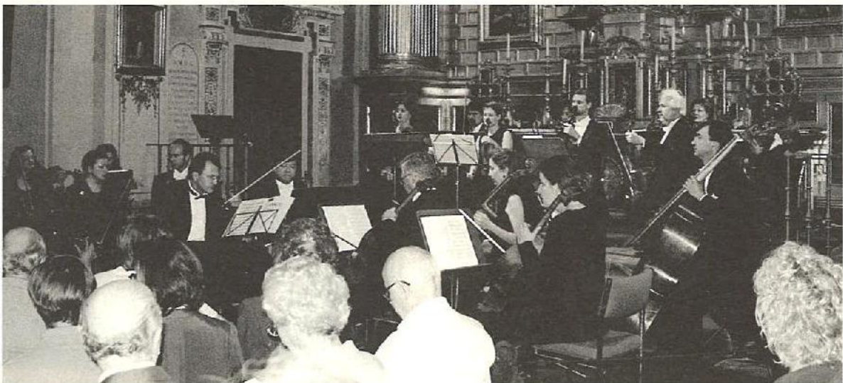
Orquesta de Cámara de la Real Orquesta Sinfónica de Sevilla.

Diez años en los que, finalmente, hemos intentado integrarnos activamente en el actual movimiento español en pro del órgano, organizando en esta sede la celebración en 1998 del III Congreso Nacional del Órgano Español, de gran relevancia en todo el mundo organístico, y colaborando decisivamente en la creación y legalización de la Asociación del Órgano Hispano, ya en marcha, que de momento ha puesto las bases del próximo IV Congreso, y que deberá canalizar y coordinar en el futuro la actividad organística de España.