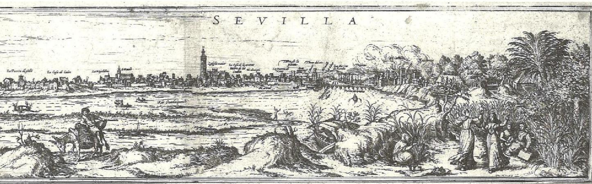
Anónimo. Vista de la ciudad de Sevilla desde la Enramadilla de Triana. 1598. Aguafuerte.

bien de contenido devocional, bien de naturaleza profana. En ella se pretende poner de manifiesto la especial capacidad de Sevilla para transformar su ciudad real en ciudad ideal y lúdica, hasta el extremo de haber hecho de tales acontecimientos efímeros y virtuales algunas de sus señas de identidad más permanentes y universales.