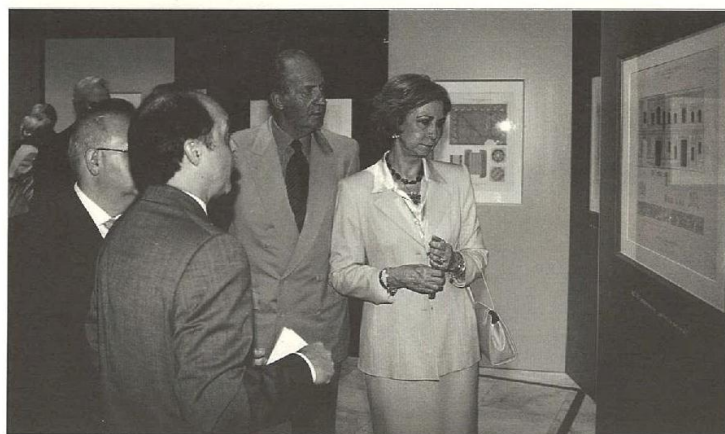
SS.MM. los Reyes junto con los comisarios de la muestra.

En definitiva este proyecto de ingeniería cultural que cuenta con el patrocinio exclusivo de Abengoa, tiene como misión difundir la imagen de la Ciudad a través de un singular patrimonio artístico atesorado por la Fundación, y que se desvela ahora en esta exposición que presentamos.