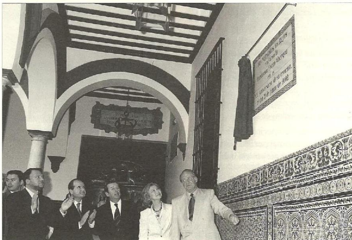
S.M. el Rey descubre la placa conmemorativa del 20 Aniversario de la Fundación Focus-Abengoa.