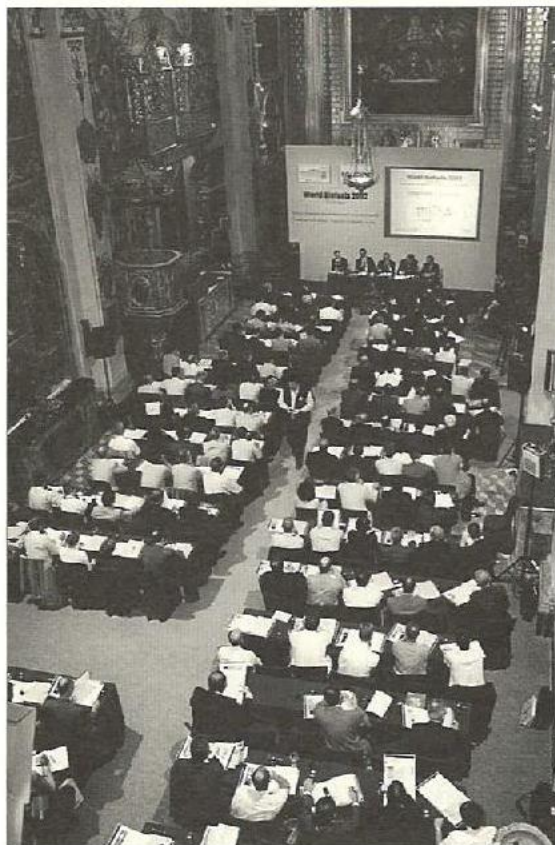
Conferencia Mundial sobre Biocarburantes.