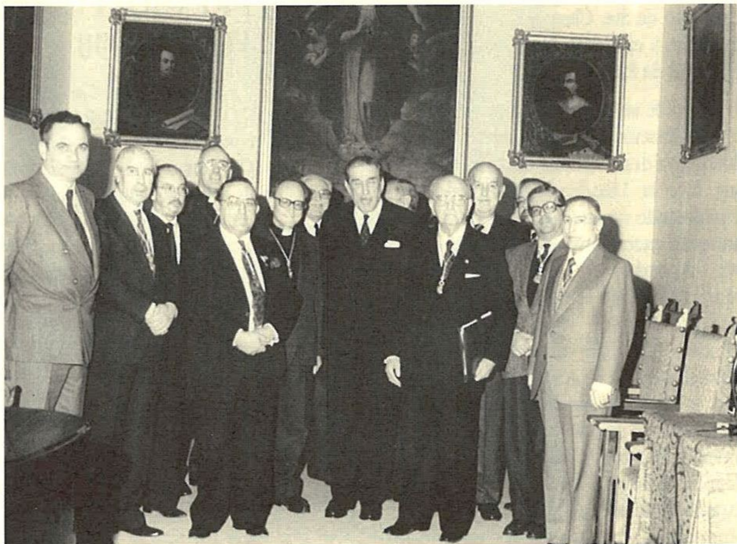
Académicos de Bellas Artes con los presidentes de la Real Academia de Bellas Artes Santa Isabel de Hungría y Focus, el día de la entrega a ésta de la Medalla de Oro.

«Vuestra Fundación posee un amplio abanico de actividades, cuya meta es la FORMACION, asignadas todas ellas, en principio, por las siguientes categorías: LABOR, AUDACIA, VIRTUD, SPES.