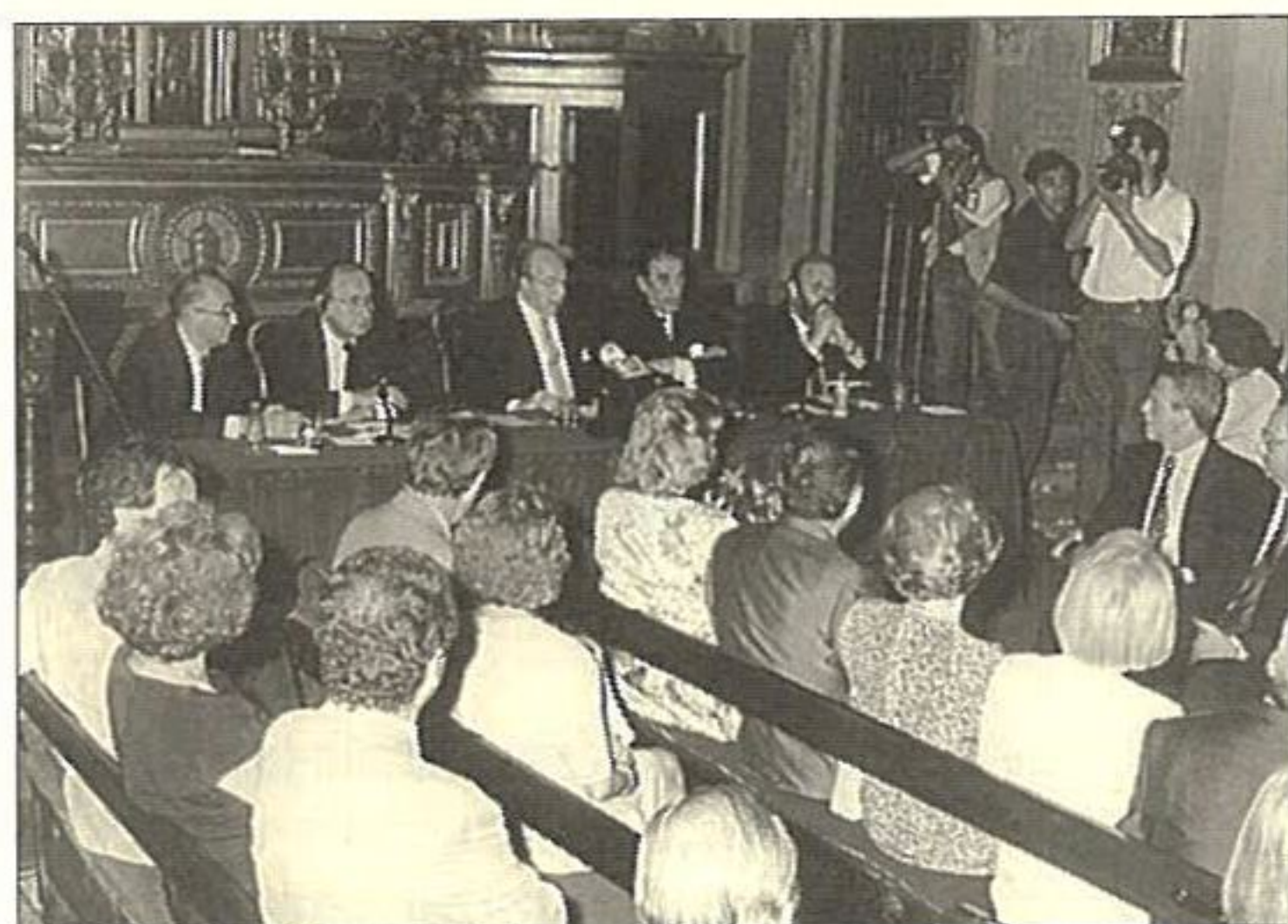
Presidencia del acto y parte del público existente, donde se distingue el ex-ministro de Asuntos Exteriores de Alemania Hans Dietrich Genscher, el Presidente de FOCUS, el Alcalde de Sevilla, etc.