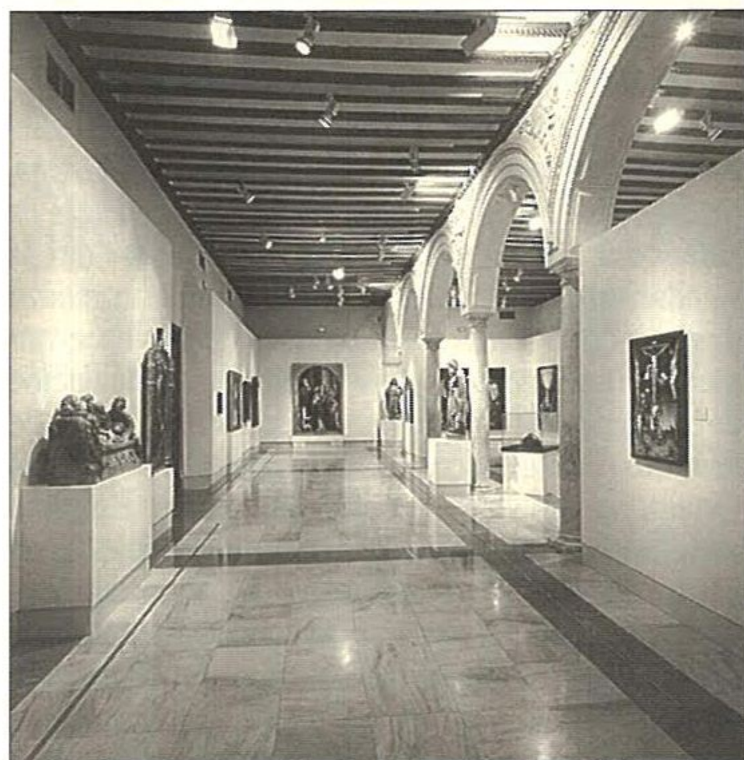
Vista de una de las salas con esculturas y pinturas expuestas en «Obras Maestras del Museo de Sevilla».

Las entrañables «servilleta», «Santas Justa y Rufina» y una impresionante «Piedad» son parte de la magna aportación murillesca a los grandes de la pintura. El acento barroco de «Las tentaciones de San Jerónimo», de Valdés Leal o el «Beato Enrique Susón», «San Luis Beltrán» y en contraposición la «Virgen del Rosario», de Francisco de Zurbarán cierran el período de mayor esplendor del arte sevillano.