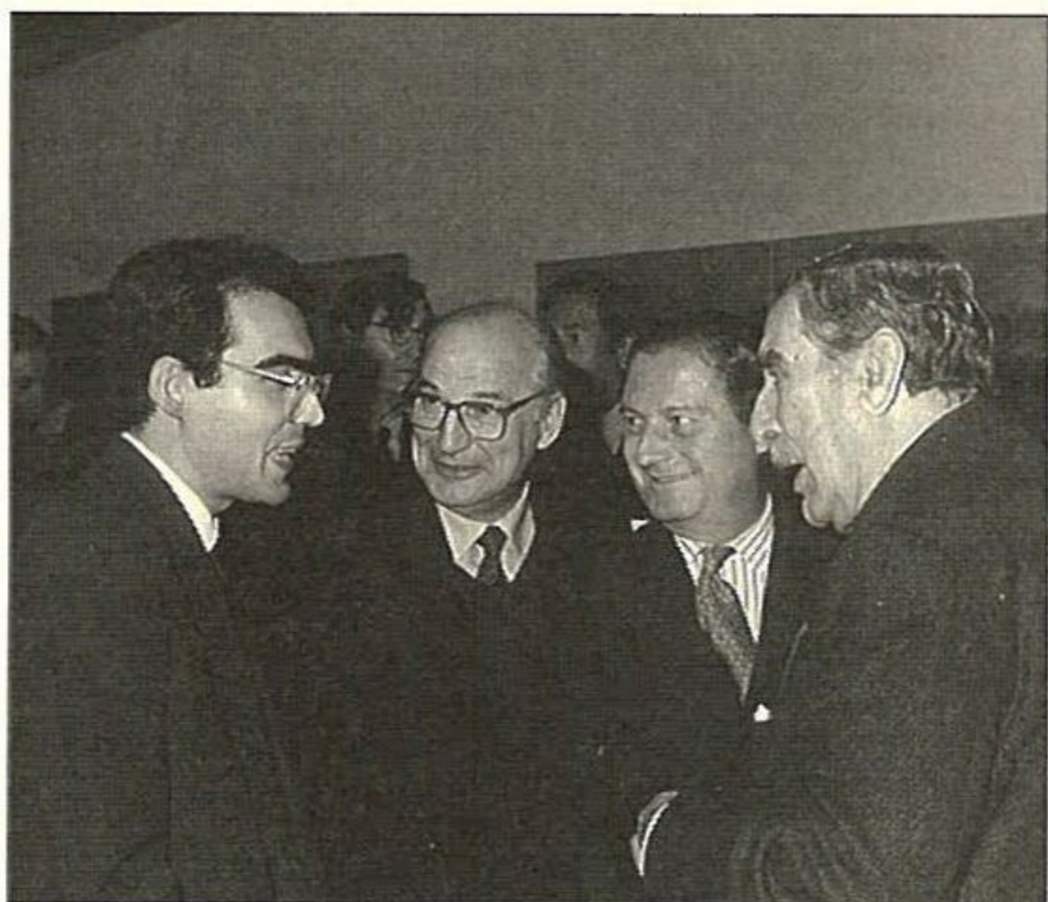
Premios FOCUS 1992

Igualmente FOCUS, teniendo en cuenta los estatutos de su carta fundacional, ha adjudicado entre los familiares del personal que presta sus servicios en la empresa ABENGOA, S.A. y sus sociedades filiales 129 Becas de Preescolar, 1.033 Becas de E.G.B., 237 Becas de B.U.P., 170 Becas de Formación Profesional, 65 Becas de Estudios Universitarios, 26 Becas de Educación Especial, 54 Becas de Graduado Social, 12 ayudas para estudio de idioma en el extranjero en cursos de verano, y siete premios de Fin de Estudios en los diversos niveles de enseñanza.