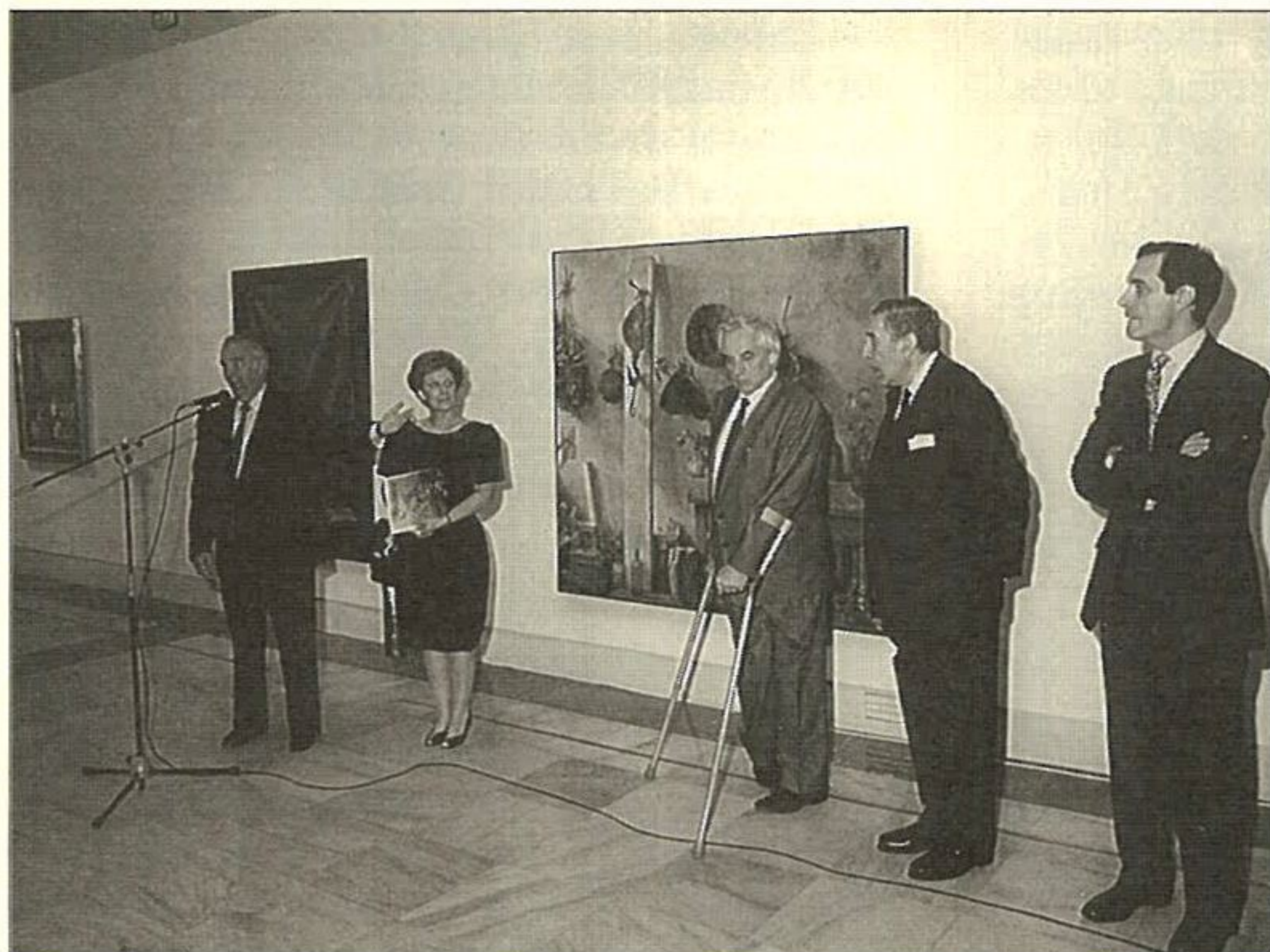
Inauguración de la Exposición de Villaseñor.

muestra que, organizada por la Obra Cultural de Caja de Madrid y presentada por FOCUS, permite contemplar una espléndida colección de la pintura de este artista que, en ella, se inicia en 1975 y alcanza hasta algunas de sus más recientes creaciones.