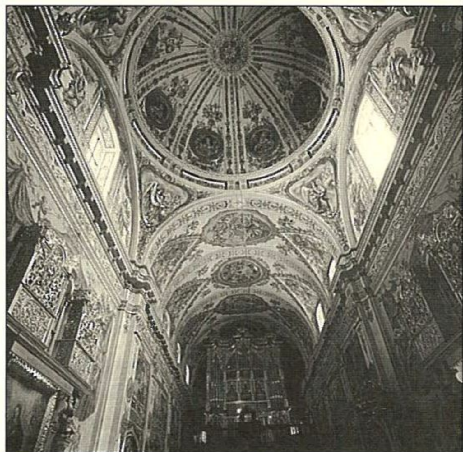
Capilla, bóveda y órgano del templo de Los Venerables.

Entre primeros de marzo y primeros de mayo de 1992 tuvo lugar la exposición de Fernando Botero titulada «La corrida», una muestra de la peculiar tauromaquia del pintor colombiano compuesta por obras realizadas desde el año 1983. Desde el pasado 5 de octubre, y hasta el próximo 15 de noviembre, se exponen en Los Venerables obras de otro autor contemporáneo, el manchego Manuel López –Villañor, considerado uno de los máximos exponentes de la pintura española actual. Se trata de pinturas realizadas entre 1975 y el presente año.