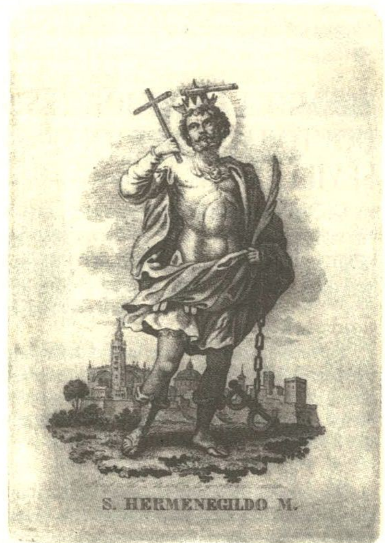
Grabado de San Hermenegildo con Sevilla al fondo.