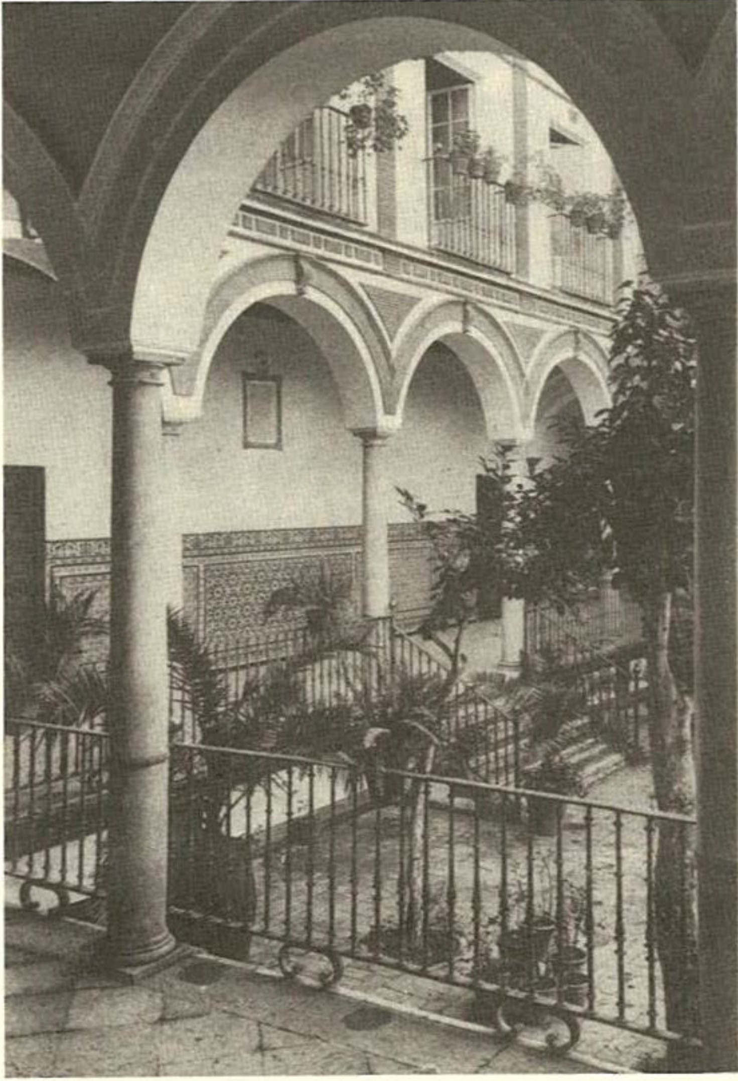
Vista parcial del patio de los Venerables.

La fachada de la iglesia, en la calle Jamerdana, carece de perspectiva para admirarla, pero tiene otro acceso por la plaza de los Venerables donde tras atravesar un patinillo y una graciosa arcada se accede al patio central rodeado de arquería. En la parte baja del edificio está la enfermería dotada de notable arquería central, la sala de cabildos y el comedor de verano. Una hermosa escalera conduce a las dependencias superiores, habitaciones dormitorio, sala de cabildos y comedor de invierno.