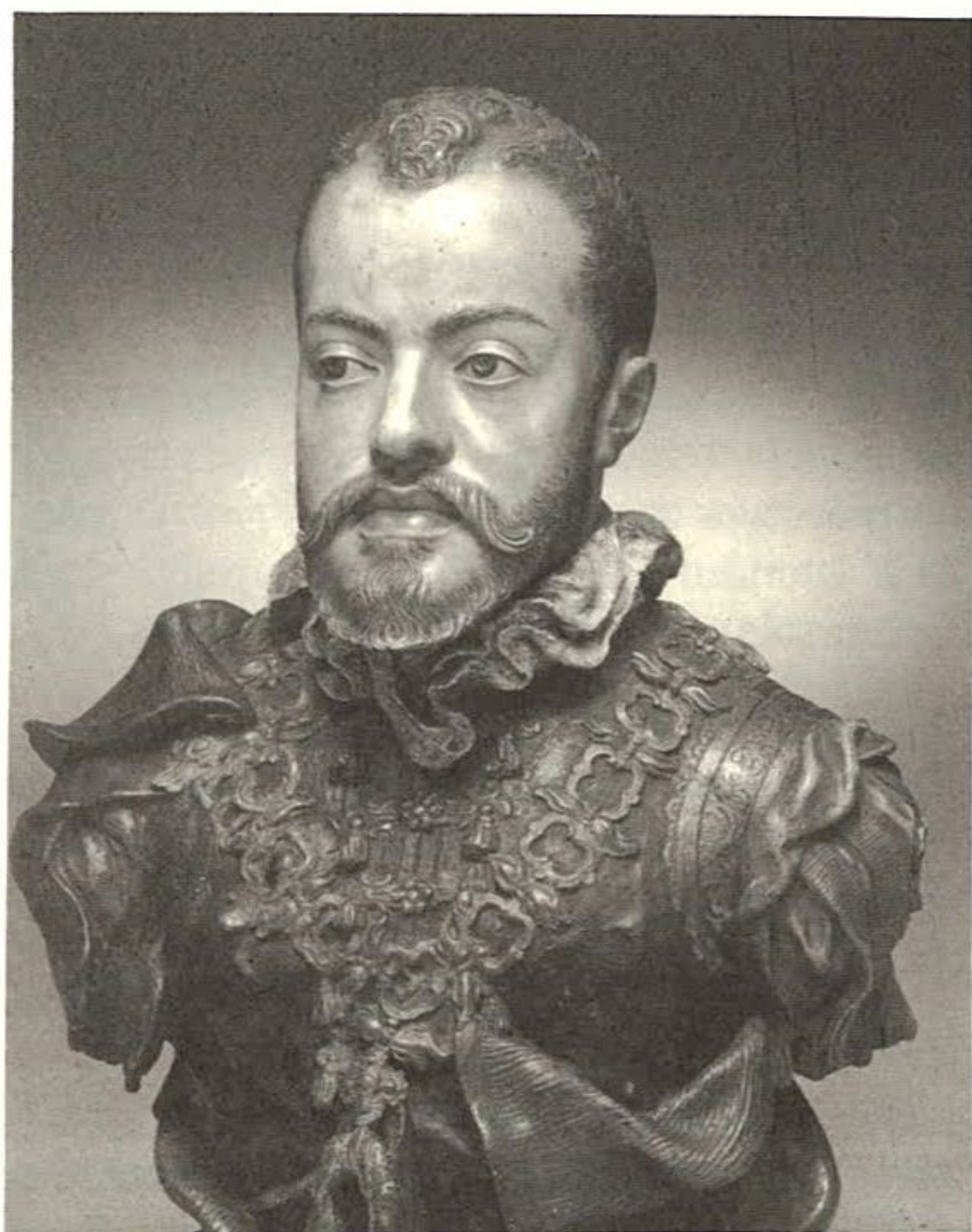
Cabeza del rey Felipe II. Plata policromada.