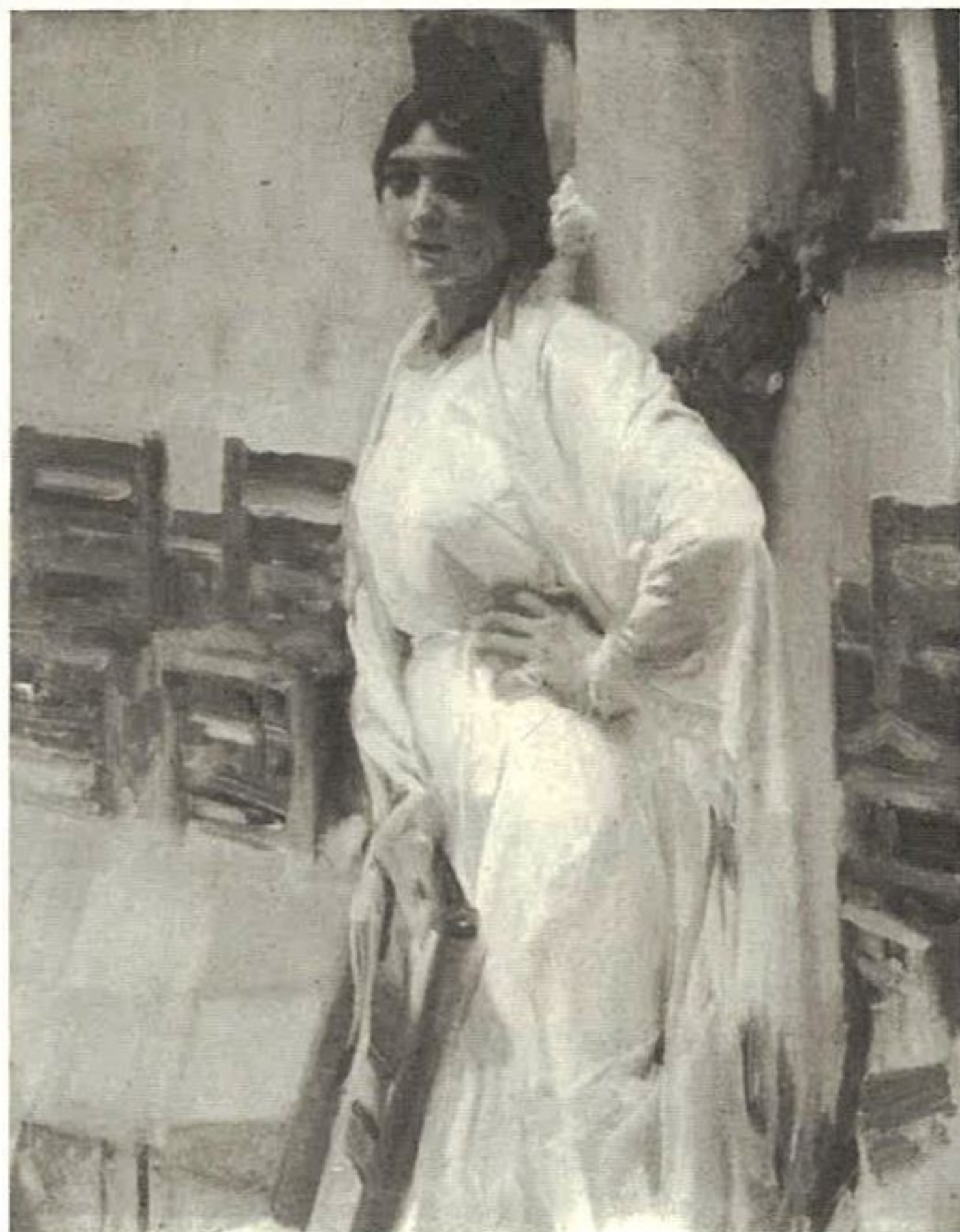
María la Guapa por Sorolla.