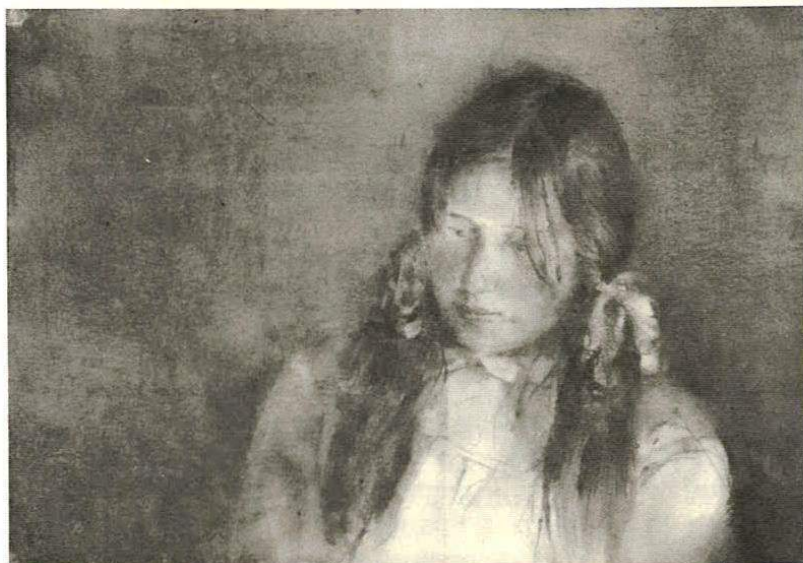
Reyes, 1972. Dibujo a carbón sobre papel. 45 x 62 cm. Colección privada. Sevilla.

En el medio centenar de obras que reúne la antología de FOCUS se refleja, a través del tiempo, las acotaciones —minuciosamente ordenadas por Gerardo Delgado—, que como decía Barthes, han