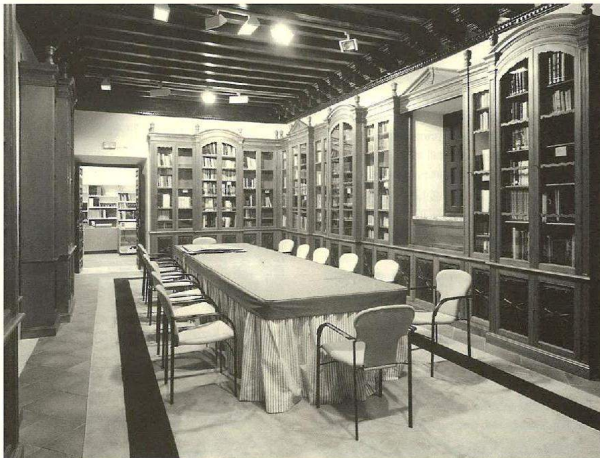
Biblioteca de la Fundación FOCUS.

Un material poco conocido que integra el patrimonio cultural de FOCUS lo representa su colección de grabados y litografías. Iniciada su recopilación en 1982, alcanza en la actualidad varios centenares de ejemplares que FOCUS ha creído conveniente catalogar y exponer. Nadie mejor para realizar esta labor que don Juan Carrete Parrondo, Director de la Calcografía Nacional. Bajo su dirección se está llevando a cabo el estudio de estas estampas, que el público interesado podrá consultar y admirar dentro de poco.