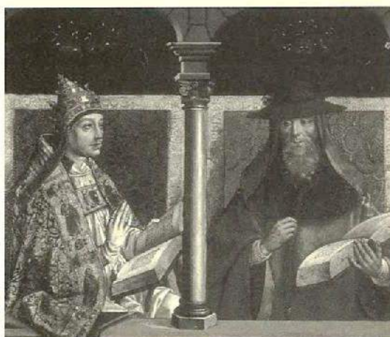
Pedro Berruguete: San Gregorio y San Jerónimo.

En 1958 Juan Antonio Gaya Nuño publicó un importante trabajo dedicado a la Pintura Española fuera de España , en la que reseñaba un total de 3.154 cuadros salidos de nuestro país en diferentes circunstancias. La cantidad y calidad de ese patrimonio disperso le permitió reconstruir toda la historia de la pintura española a base solamente de obras que se encontraban fuera de nuestro país.