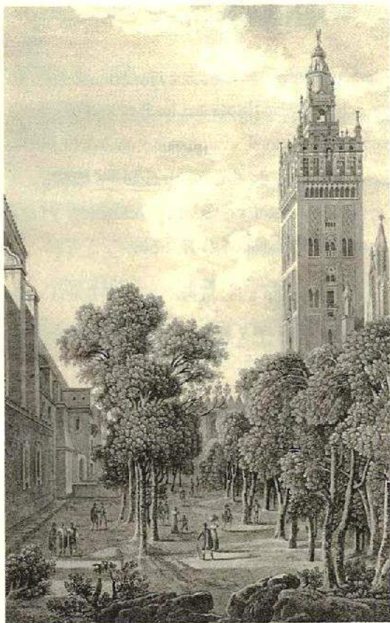
Vista de la Giralda. Alexandre Laborde: «Voyage pittoresque et historique de l'Espagne». 1812.

La colección de estampas que ha reunido FOCUS es la mejor que existe sobre iconografía de Sevilla, aseguró Juan Carrete, comisario de la muestra y director de Calcografía Nacional. El antecedente de FOCUS es la colección de grabados. Fue la primera actividad cultural de ABENGOA —la empresa que creó la Fundación— y por eso hemos querido celebrar los primeros cinco años en Los Venerables con esta muestra que, a partir de ahora, se exhibirá de forma permanente, afirmó Francisco Morales Padrón, director de FOCUS. Las obras se irán renovando, puesto que la fragilidad del papel impide que estén colgadas más de dos meses.