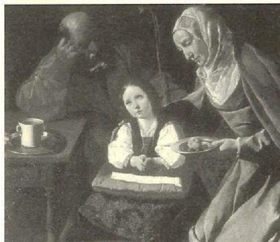
Francisco de Zurbarán: La familia de la Virgen.

El conjunto expuesto lo integran 67 pinturas españolas de los siglos XV al XVIII de las cuales sólo 11 estaban recogidas por Gaya Nuño. Su estudio proporciona una imagen muy viva del coleccionismo actual: