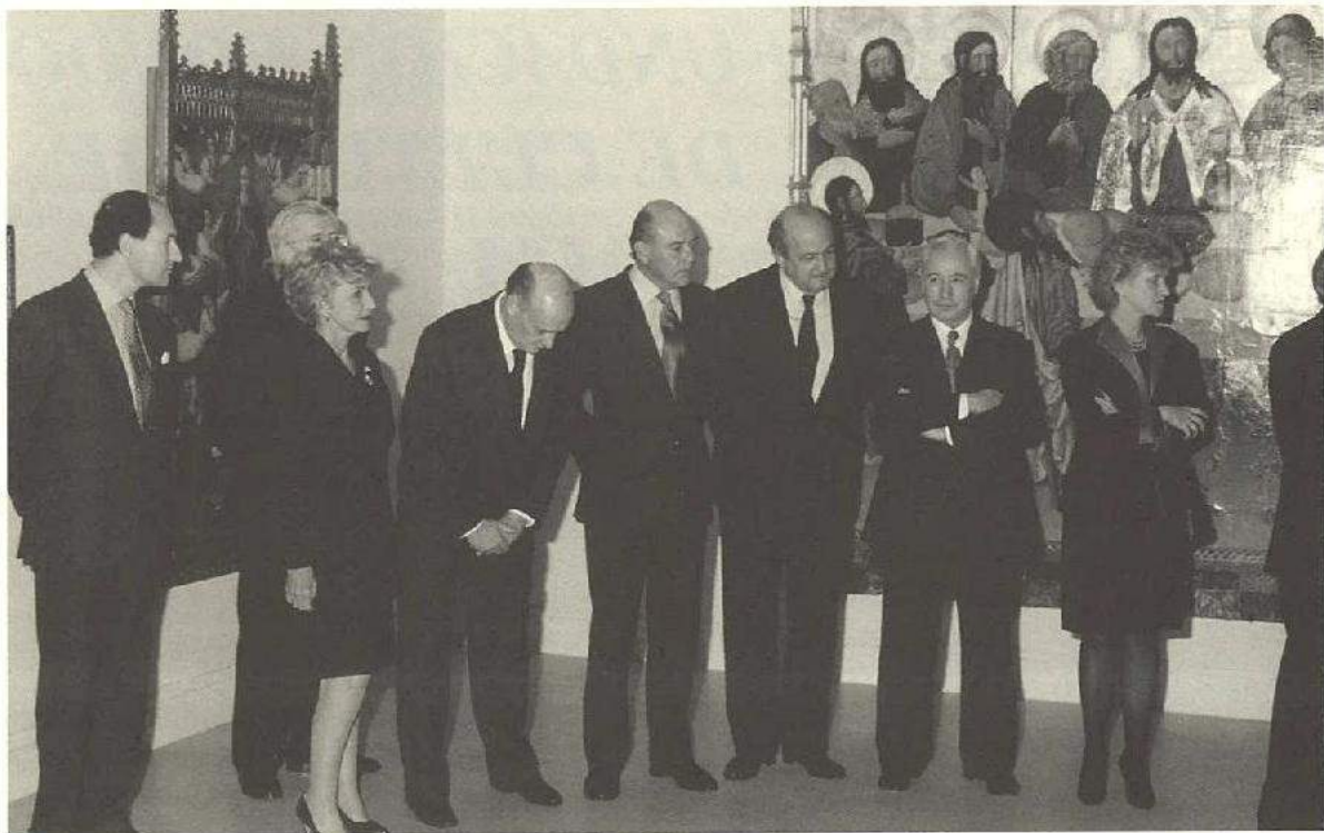
Junto a la alcaldesa de Sevilla y el Comisario de la exposición figuran los titulares de las colecciones privadas que cedieron sus cuadros para organizar esta muestra.

“Hay piezas maestras que se han comprado hace muy poco como Inmaculada Concepción , de Antonio del Castillo y Saavedra, cordobés del siglo XVII con obras en la mezquita-catedral o El olfato , de Ribera, pintado durante sus primeros años en Roma”, dice el comisario. Junto a los grandes nombres de la Historia del Arte español, se exhiben obras de artistas menos conocidos pero de gran calidad.