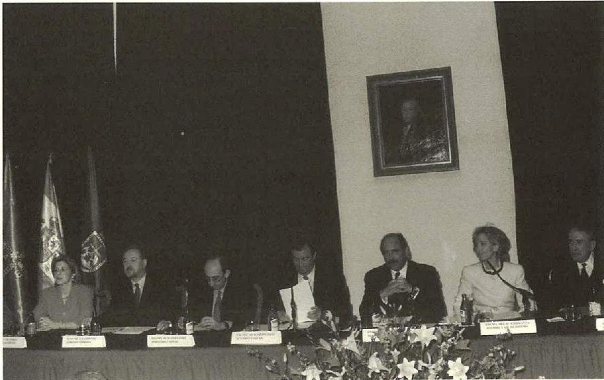
Presidencia de los actos celebrados en el Museo de Bellas Artes de Asturias.

El Presidente del Principado, Sergio Marqués, presidió como anfitrión la inauguración. Su discurso cerró el acto oficial, Marqués calificó la inauguración de «momento feliz» para Asturias y apostó porque la región se convirtiera en «un faro cultural», aunque matizó que la luz de ese faro debía ser permanente.