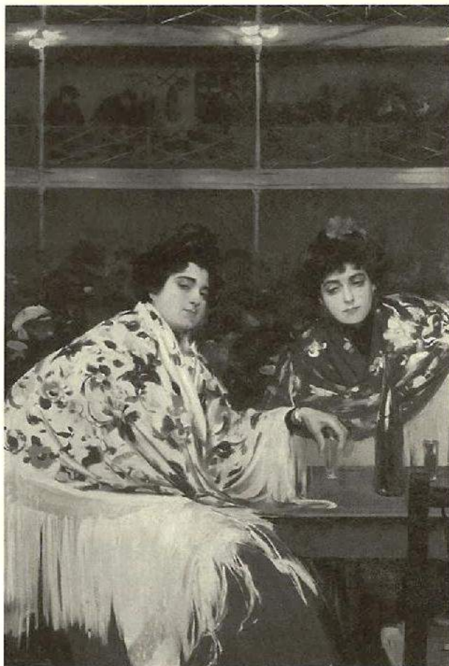
«Café Concerto», por Ramón Casas.

La exposición recoge así mismo obras de algunos autores y movimientos artísticos que tomaron el relevo del Modernismo, y que ayuda a situar este fenómeno al que seguirá el Novecentismo. Además de los cuadros se expone el Libro de Honor del Círculo, realizado en piel y plata en 1908 por Lluís Masriera, artista y joyero perteneciente a una de las familias de orfebres barcelonesas más conocidas.