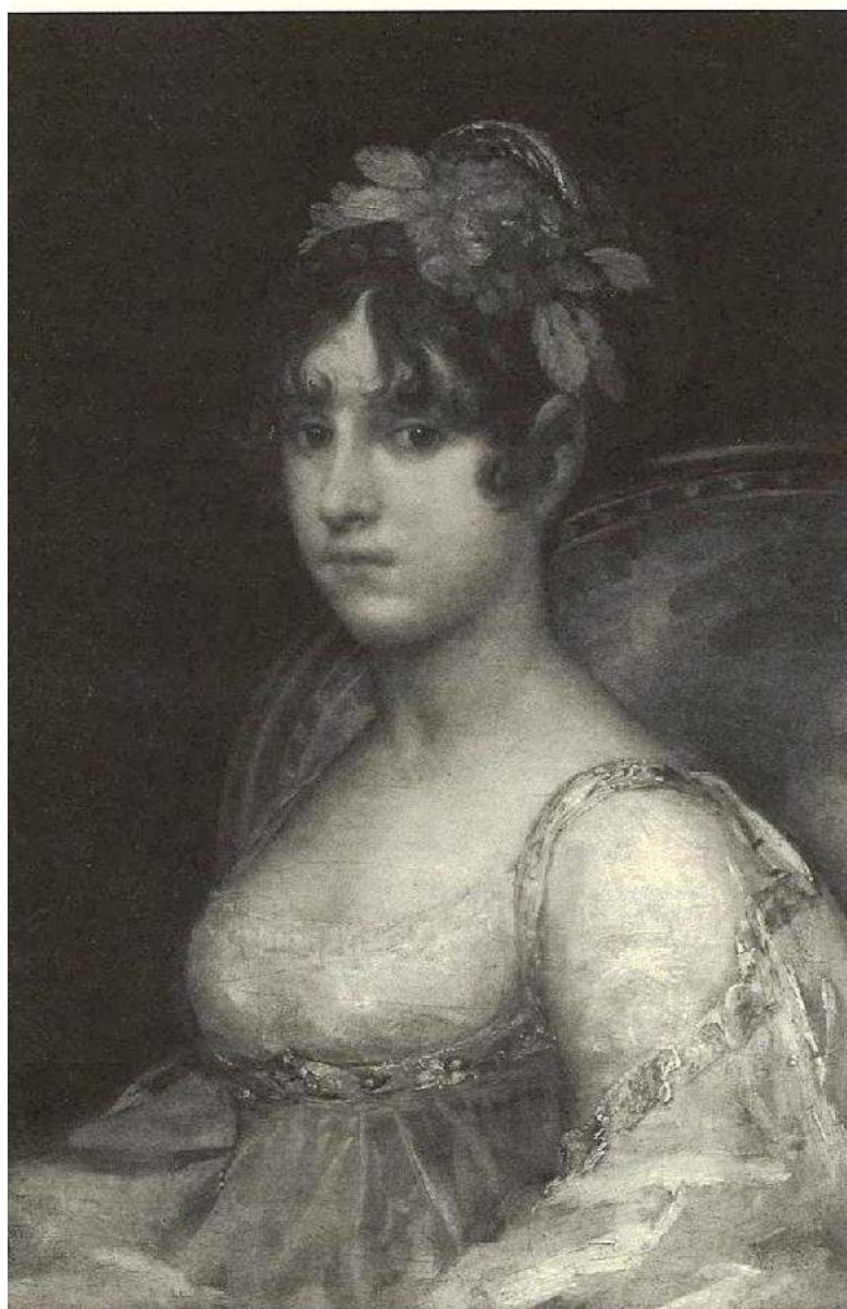
Retrato de la Condesa de Haro, por F. de Goya

Atareada la Fundación con sus diversas actividades, conciertos y exposiciones sobre todo, hace un alto en el camino y, vestida de gala, en el ámbito excepcional del templo de Los Venerables, le satisface participar a la sociedad el nombre de diversas personas que, por uno u otro mérito, han ganado un honor.