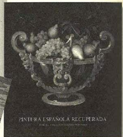
PINTURA ESPAÑOLA RECUPERADA