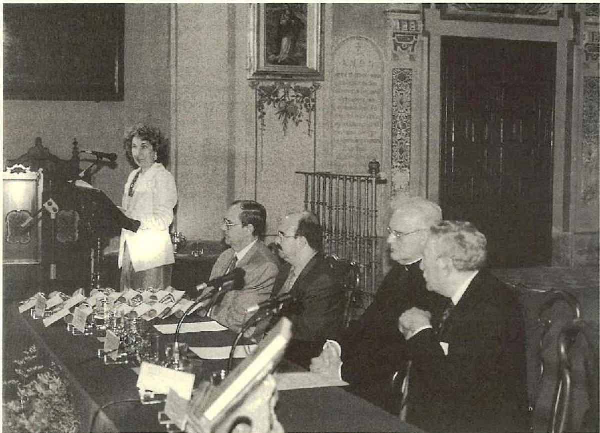
La Catedrática y Académica Profesora Carmen Iglesias durante su intervención.