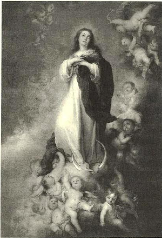
Murillo: Inmaculada de Los Venerables

Con relación a Los Venerables recordemos que las postrimerías del XVII fueron testigos de un importante acontecimiento: el final de su templo, decorado con pinturas de Murillo y de Valdés Leal. Cuenta Ortiz de Zúñiga que Don Pedro Colbert, Almirante General de la Armada de la Mar Océana «dirigió y dispuso» las pinturas de la Iglesia, pero no tuvo el gusto de ver colocar el Santísimo pues murió de un «insulto» (indisposición repentina).