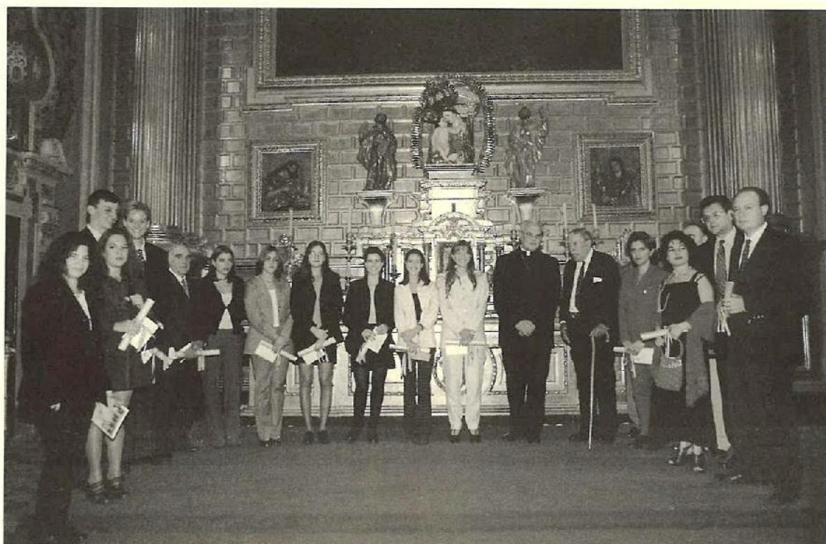
Los premiados con los Señores Arzobispo y Presidente de FOCUS.