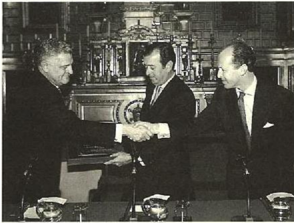
Entrega Premio Patrocinio y Mecenazgo de la CEA a la Fundación Focus-Abengoa.

Sólo por esta condición, el empresario merece el reconocimiento general; y merece convertirse en el referente para las nuevas generaciones de jóvenes que aspiran a un empleo y al bienestar.