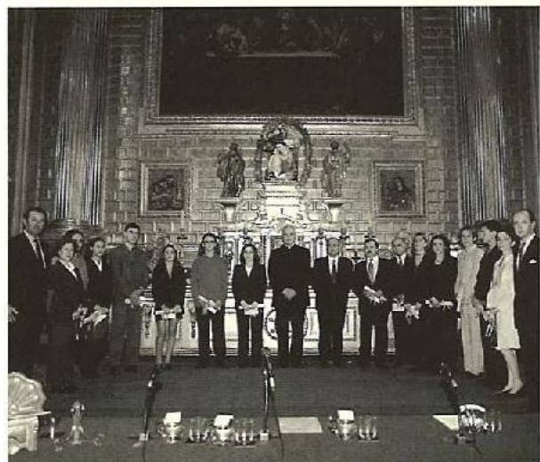
Los Premios Focus-Abengoa 1998