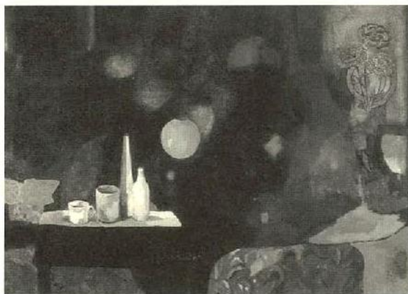
«Interior» Concha Ybarra Mencos

La pintora premiada, Inmaculada Gómez-Alvarez Salinas, licenciada en Bellas Artes por la Universidad Hispalense, se dio a conocer a principio de la década de los noventa con el Primer Premio Ron Bacardí de Pintura, 1991; y al año siguiente por otros primeros premios, «Vázquez Díaz» de Pintura, y Ayuntamiento de La Rinconada. Expuso en la galería Haurie de Sevilla y mantiene su línea de éxitos con otros galardones –Premio Ejército del Aire en 1995, de Madrid, entre ellos –, y exposiciones en Andalucía, España y en el extranjero.