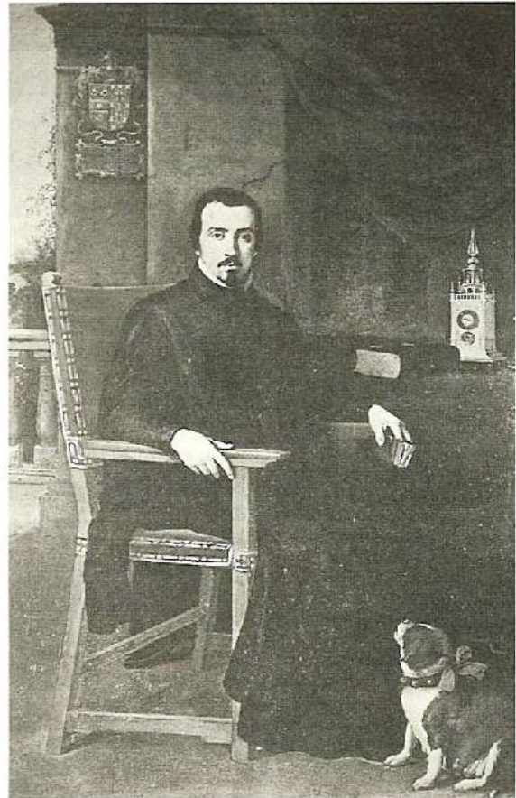
«D. Justino de Neve». B. E. Murillo