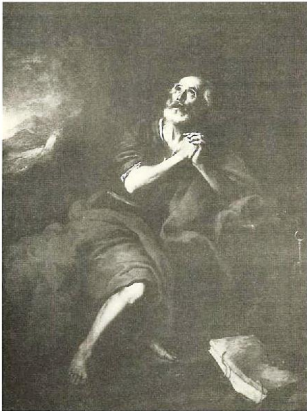
«San Pedro penitente». B. E. Murillo