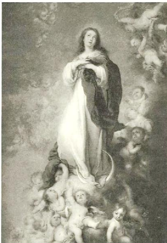
«Inmaculada de los Venerables» B. E. Murillo