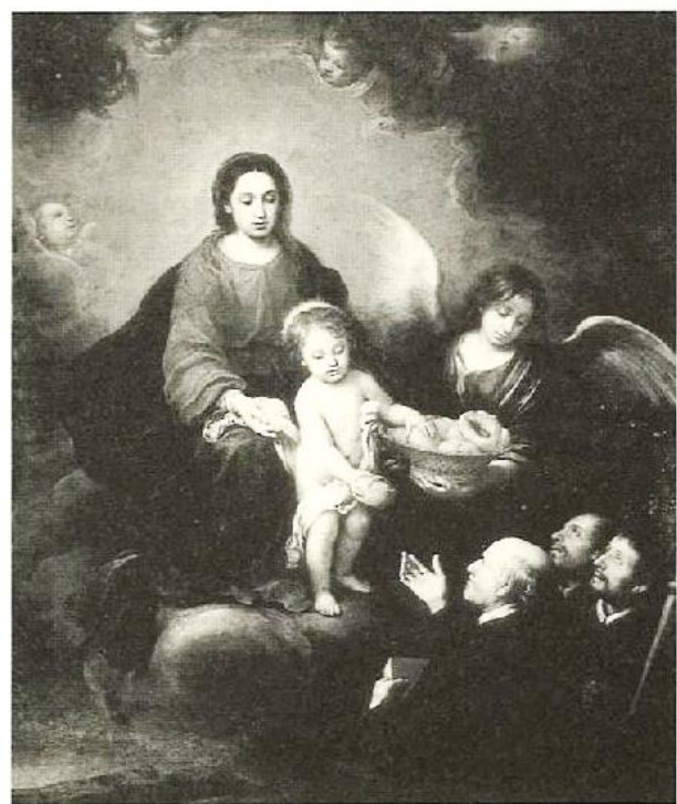
«Virgen con el niño distribuyendo pan a unos sacerdotes» B. E. Murillo