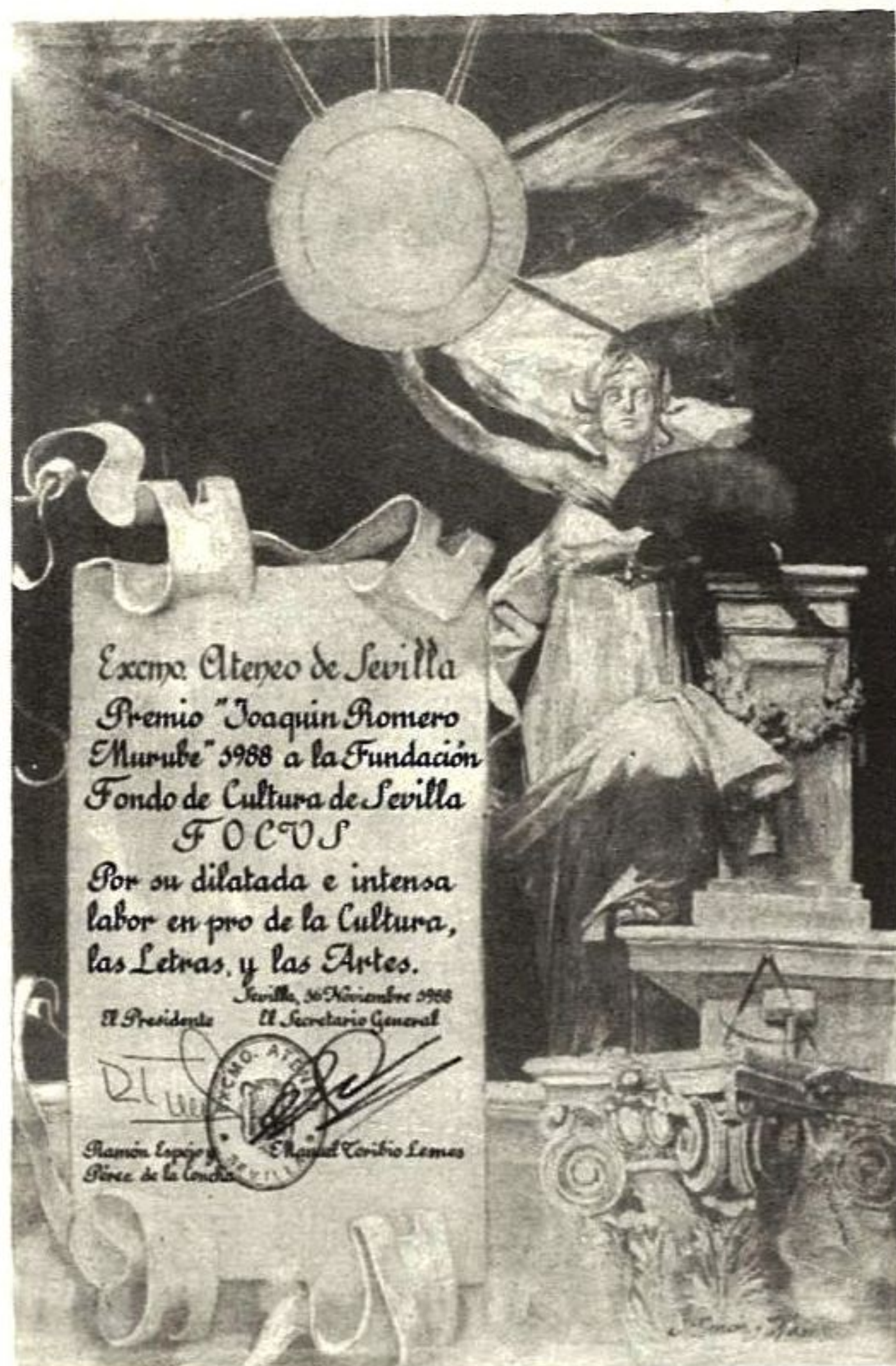
Pergamino donde se recoge el Premio Romero Murube.

Seguimos construyendo una ciudad falsa, llena de lugares comunes, que una y otra vez repiten aquello