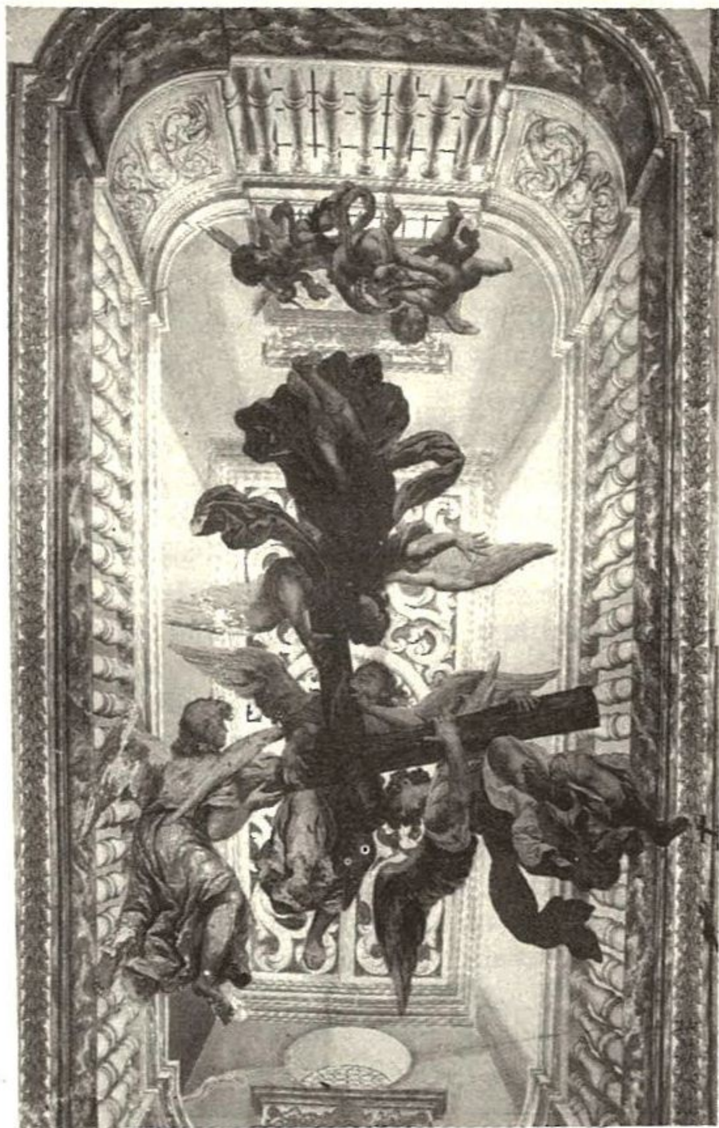
Techo de la Sacristía de los Venerables por Valdés Leal

La intervención directa de Valdés Leal en la iglesia de los Venerables se completa con la ejecución del repertorio de ángeles que figuran en las pechinas de la media naranja y en los medios puntos de los muros laterales. Son en total ocho representaciones de ángeles, todos ellos magníficamente dibujados por su propia mano, pero coloreados con gran dureza, lo que hace suponer que ésta última labor sólo la realizó el artista en pequeña proporción, correspondiendo a su hijo Lucas su mayor parte. Cada uno de los ángeles lleva objetos que son necesarios en la celebración de la Misa, como cruz de altar, cáliz, vinajeras, casulla, misal, ara, mantel del altar, alba y dalmática. Todos están efigiados con rasgos de jóvenes manebros y están acompañados por pequeños ángeles. Cada escena se enmarca con molduras de fingida arquitectura de movido diseño y con guirnaldas de flores y frutos.