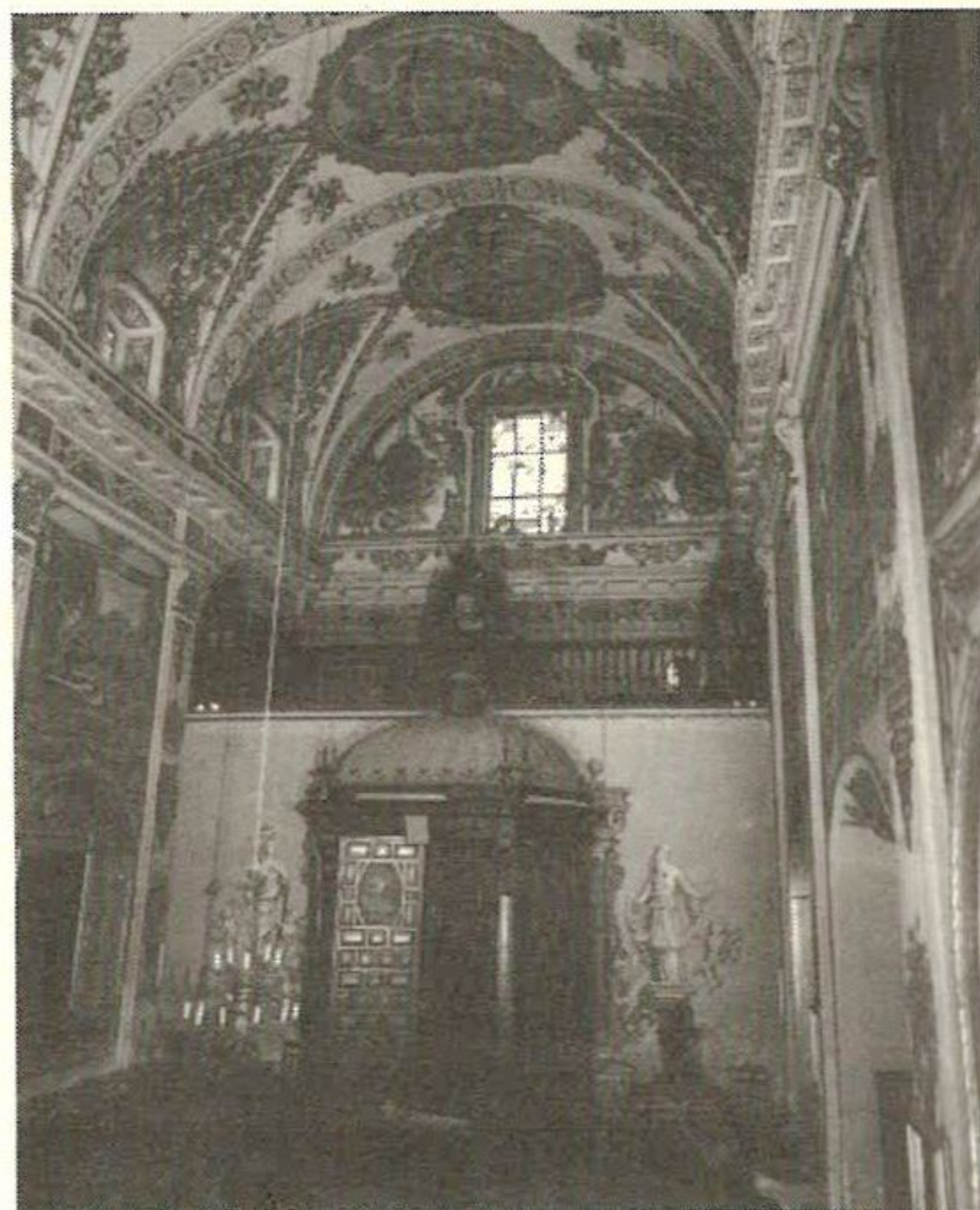
Bóveda, coro y parte trasera del templo de Los Venerables.